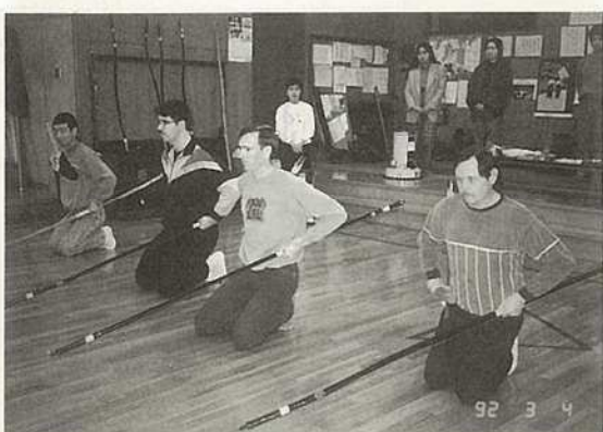
礼儀が第一 まずは精一心から