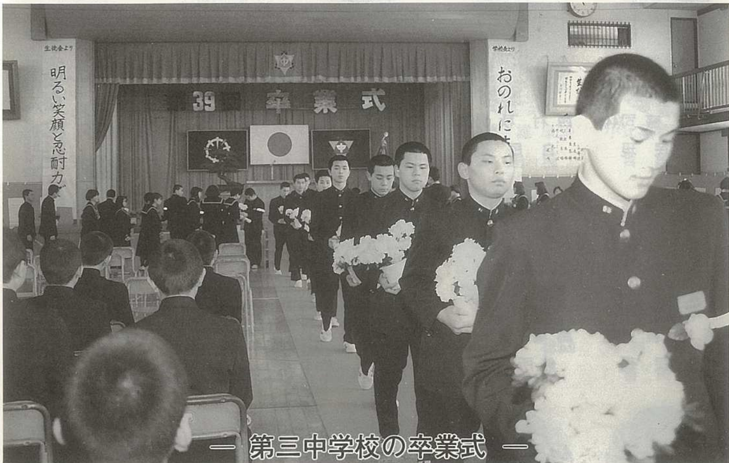
— 第三中学校の卒業式 —