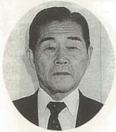
工藤 嘉太郎(68) 自民現