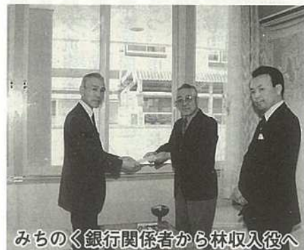
みちのく銀行関係者から林収入役へ