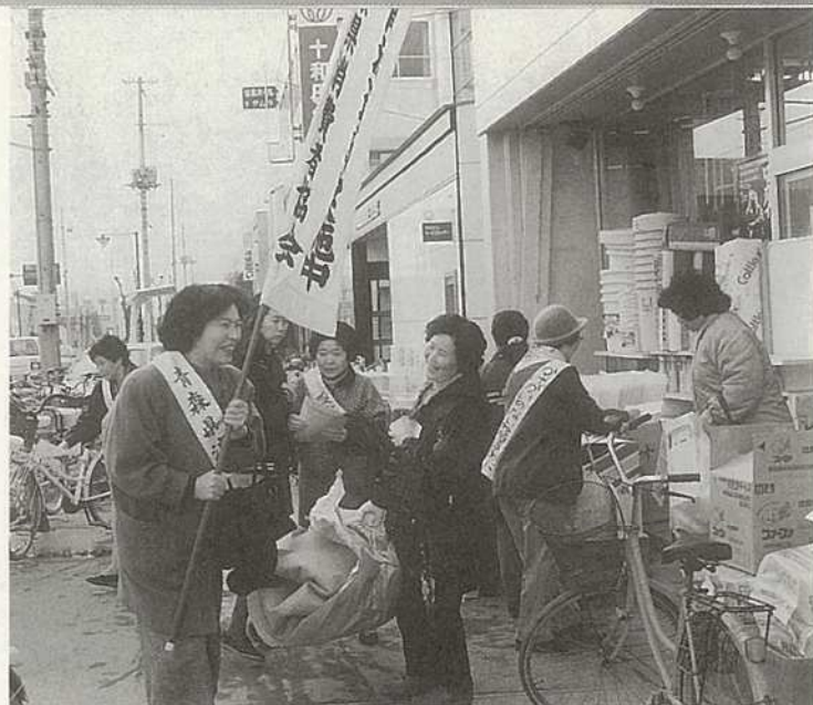
商店街で運動をピーアール