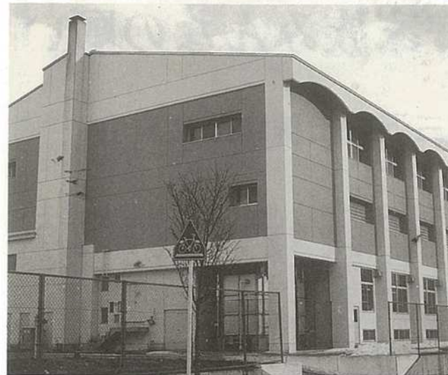
二階建の体育館が完成 一階が道場、二階が講堂に