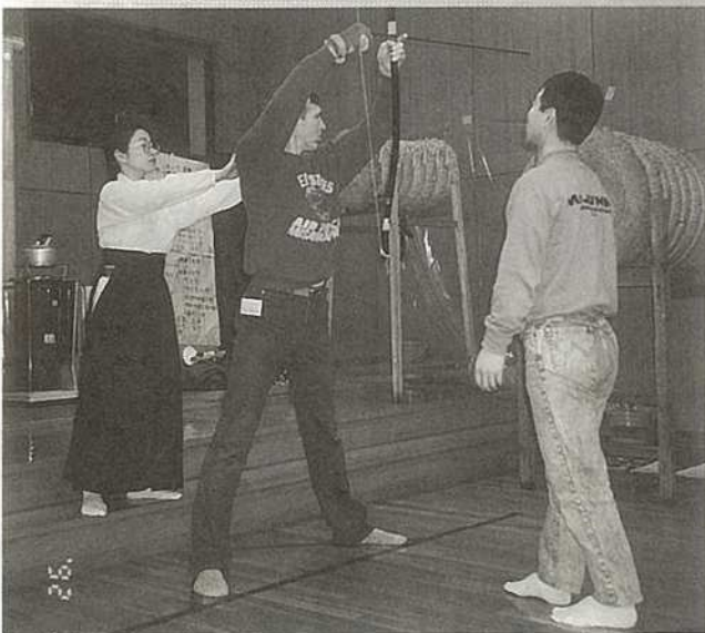
指導を受ける姿勢も真剣そのもの