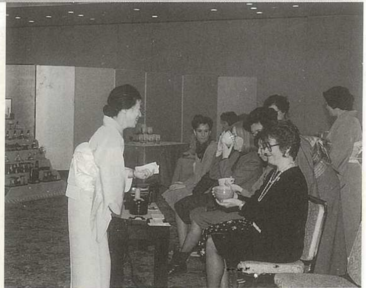
抹茶でおもてなし