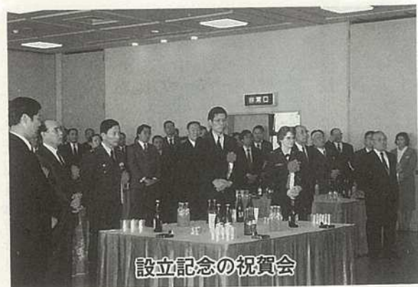
設立記念の祝賀会

二十一世紀に向けて国内各地では、地域レベルでの国際化に対応した施策が急務とされており、そのための環境づくりを進め、計画的な国際化を推進しています。