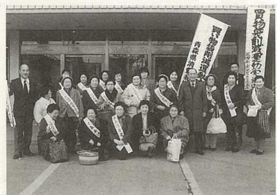
出発の前に市役所の玄関前で記念撮影

二月十七日から三月十三日まで武道館で行われた教室には、米国人が多数参加。午後七時からと寒い中ではありましたが、日本古事の伝統と美について真剣に学ぶ姿が新鮮でとても印象的でした。