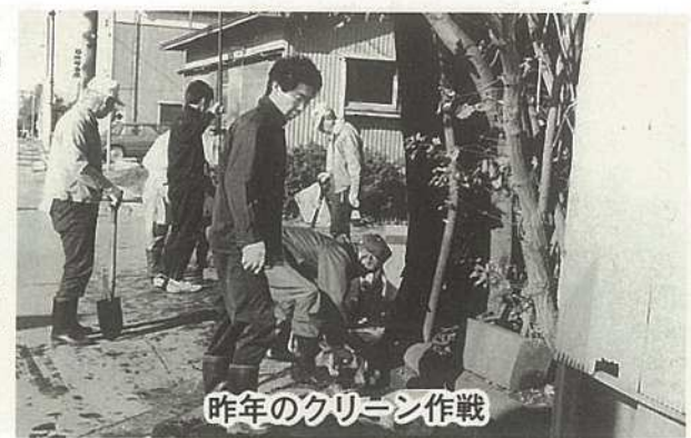
昨年のクリーン作戦

「市民ひと掃き運動」としてすっかり定着した「春のクリーン作戦」が四月十九日、市内全域を対象に行われます。