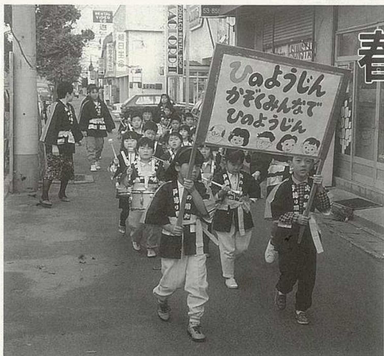
— 秋の火災予防運動から — 火の用心の行進をする 幼年消防クラブ員の皆さん

この機会に、このような行事に積極的に参加をし、煙の恐ろしさをはじめ、火災の際の避難の方法や、日頃使用することのない消火器など各種防災機器の正しい取り扱い方法等に習熟するように心がけましょう。